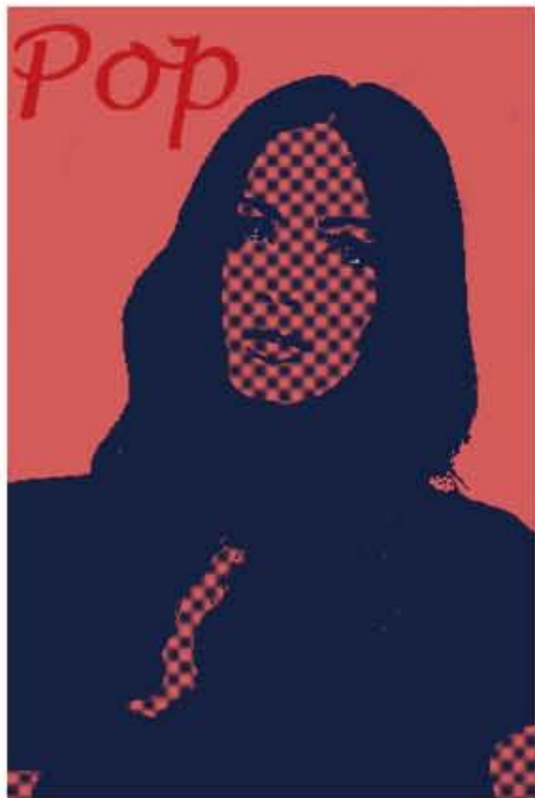
普普風-梅根福克斯 利用及photoshop一步一步照著老師講義說成來完成