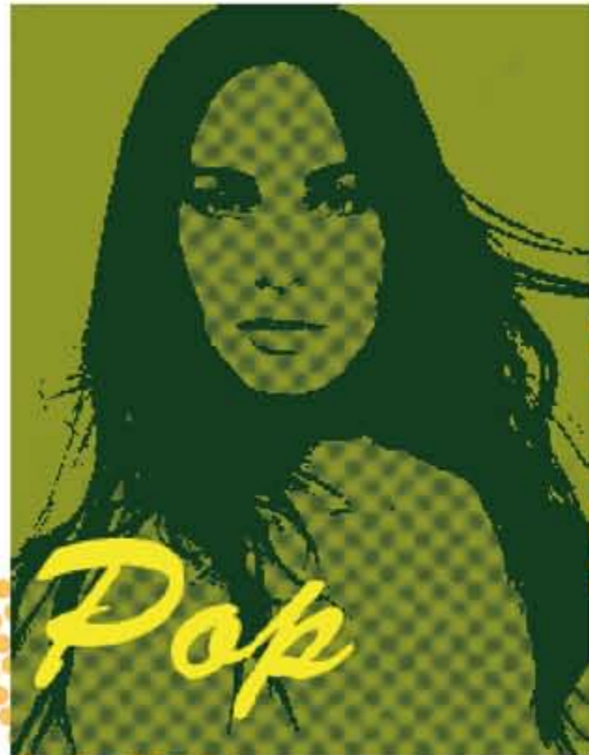
普普風-梅根福克斯 利用及photoshop一步一步照著老師講義說成來完成