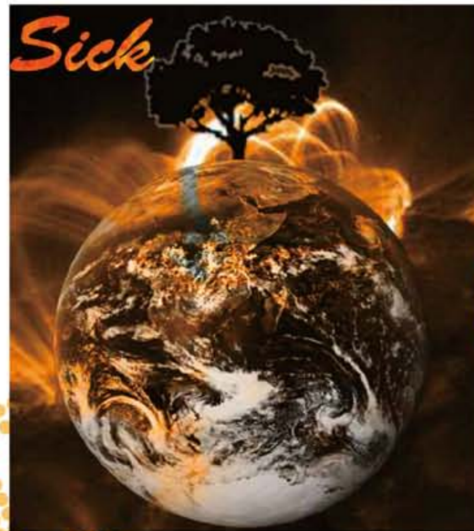
海報-sick 黑色的地球以及樹,表示出地球的衰敗 從背景的黄光,透漏出地球被侵蝕毀壞的可怕!