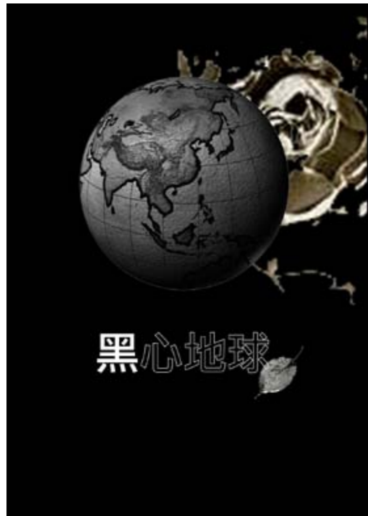
海報-黑心地球 以黑與白色來詮釋整張海報,表現出地球不再是綠意盎然 生態環境的壞敗,連葉子也不在綠,強調地球遭受到強大的傷害