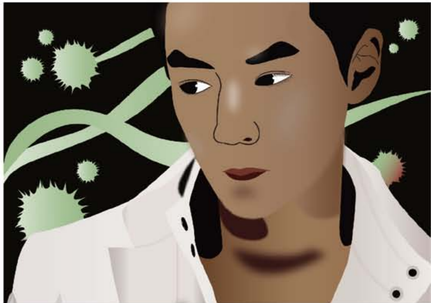
人像插畫-吳彥祖 使用以拉製作的,還滿有趣的一項作業!