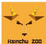
Hsinchu ZOO 新竹市立動物園