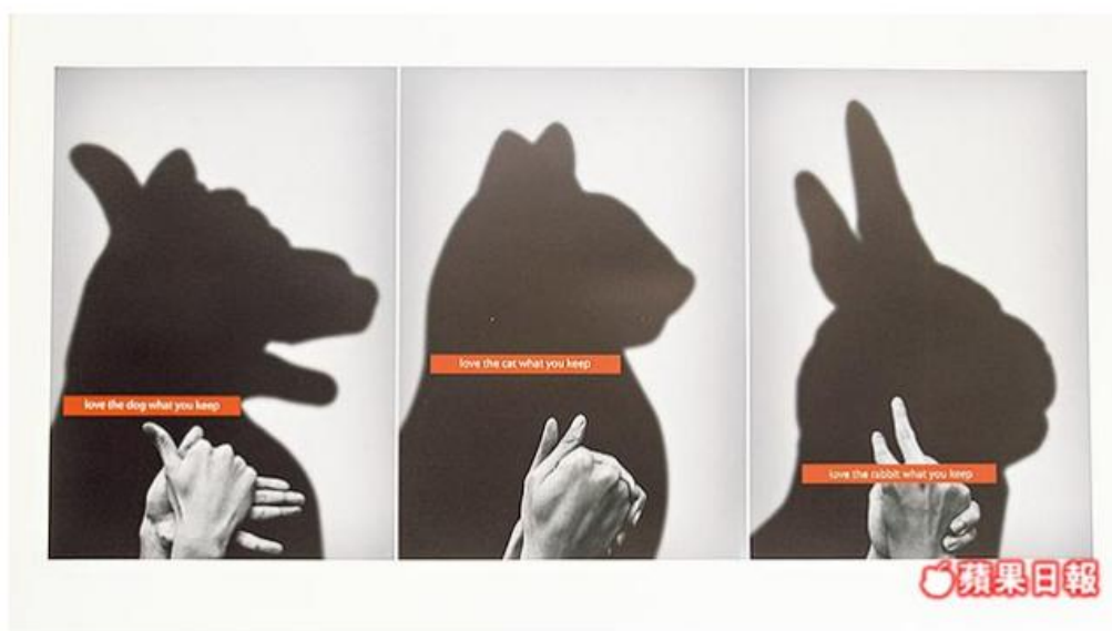
「守護動物」 台科大另3名學生的海報作品，也在德國紅點設計獎大放異彩。