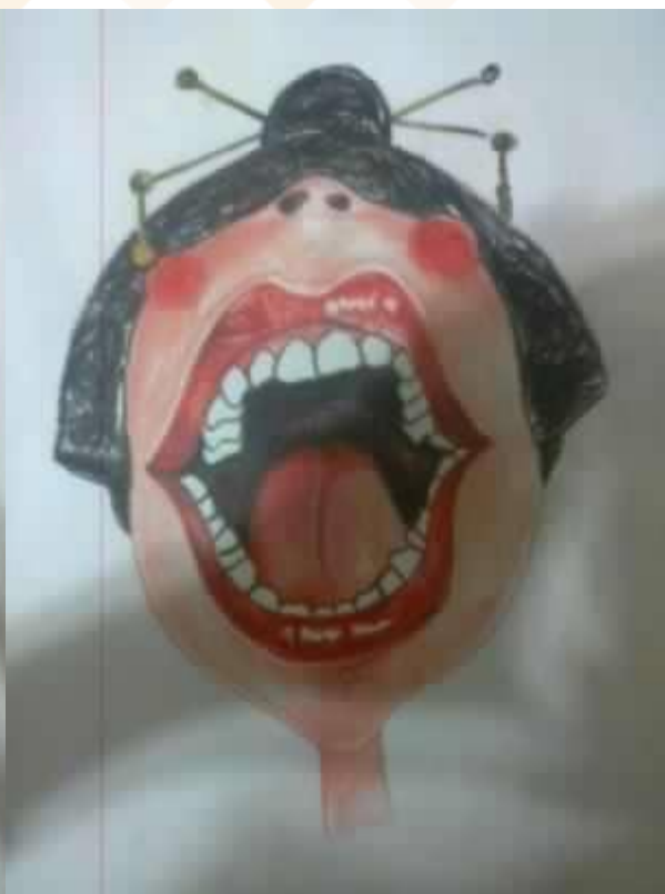
↑ 白人 ( 牛奶巧克力 )