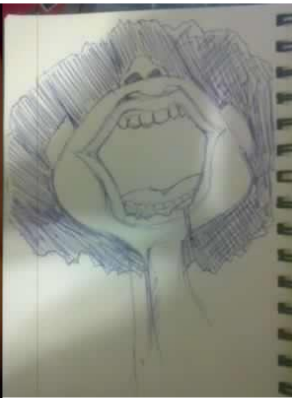
↑ 黑人 ( 黑巧克力 )