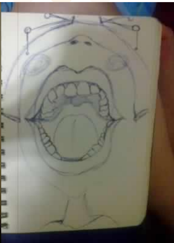
↑ 白人 ( 牛奶巧克力 )