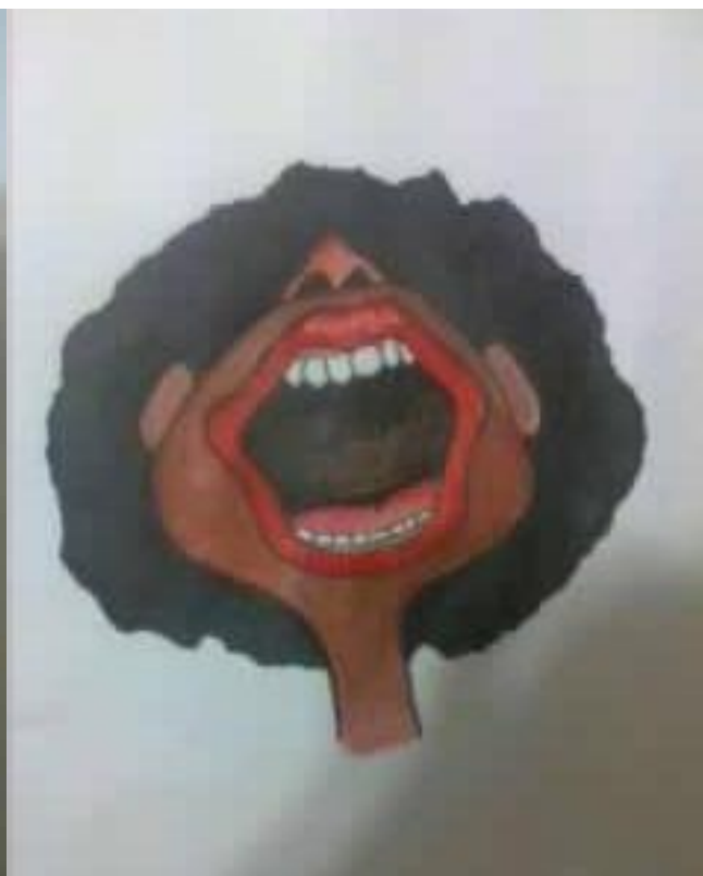
↑ 黑人 ( 黑巧克力 )