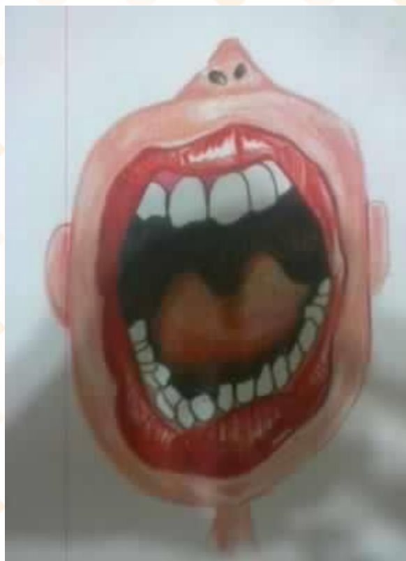
↑ 黃人 ( 草莓巧克力 )