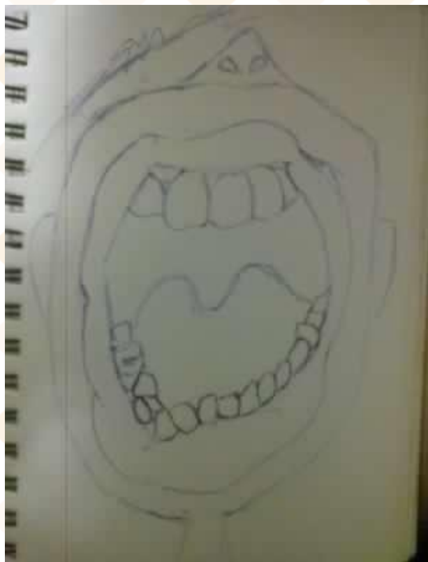
↑ 黃人 ( 草莓巧克力 )