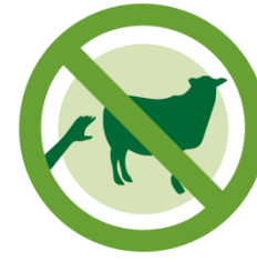
請勿推羊 DO NOT PUSH