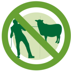
請勿拉羊 DO NOT PULL