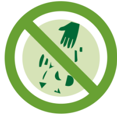
請勿隨地丟垃圾 NO LITTER