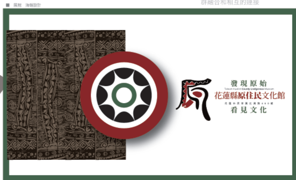
象徵 祖靈之眼和阿美族太陽神